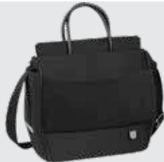
Código 872313 Mala, com colchão para troca de fraldas