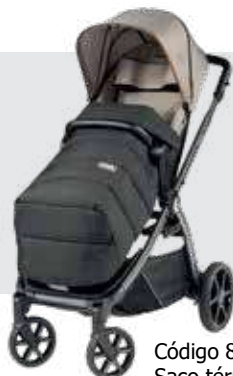
Código 872316 Saco térmico de capa de inverno