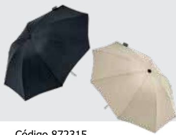
Código 872315 Guarda-chuva, disponível em preto ou bege. Atenção: para montá-lo, é necessário o adaptador, vendido separadamente.