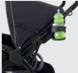
Código 872310 Suporte para bebidas, pode segurar uma mamadeira ou uma pequena garrafa de água