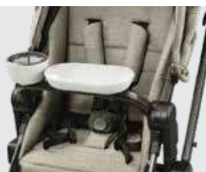
Código 872321 Tabuleiro, com suporte para copo e recipiente.