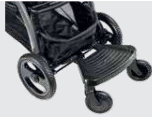
Código 872311 Plataforma traseira, deve ser fixada ao carrinho para transportar crianças mais velhas (até um peso máximo de 22 kg)