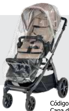
Código 872319 Capa de chuva cristal