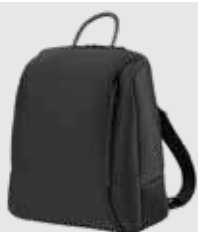
Código 872312 Mochila, com colchão para troca de fraldas