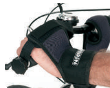
E10 -Fixação de mão com cintas