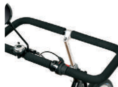
S4 -Guiador fechado