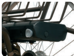
BAT 9 -Bateria peça sobresselente 9A