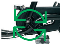
O6 -Pinhão fixo