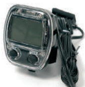
E3 - Conta Km