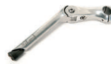
S5 -Suporte de direção ajustável (-10° a +50°)