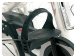
F1 -Pedais com fixação