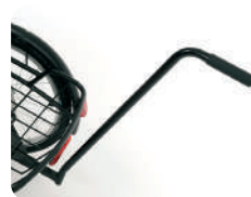
E1 -Barra de empurrar (335 mm ou 605 mm)