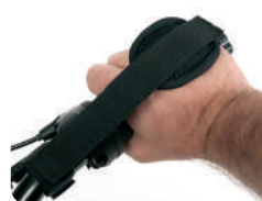
E9 - Cintas de mão