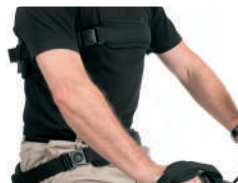
P3 - Suporte costas e bacia