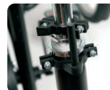
D1 -Sistema de bloqueio do guiador