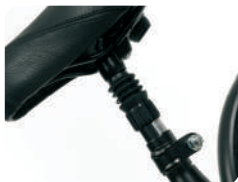
P5 -Tubo do selim com amortecedor