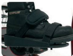
F3 -Pedais com sandálias