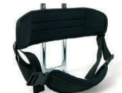
P2 -Suporte de encosto