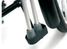
E6 -Suporte para muletas