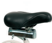
P4 -Selim ajustável (140 mm)