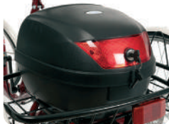
E5 -Bagageira (30 litros)