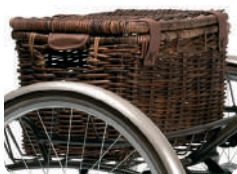
E4 -Cesta vintage