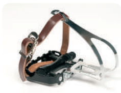
F2 -Pedais tipo ciclista