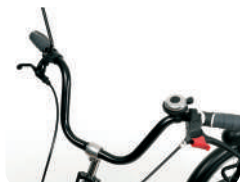
S1 -Guiador padrão