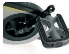
F5 - Pedais ajustáveis em comprimento (22 m)