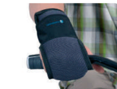
E11 -Fixação mão