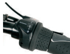
O3 -3 marchas O7 -7 marchas