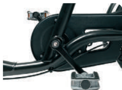
O1 + B1 -Roda livre