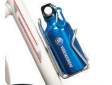
E7 - Porta-garrafas