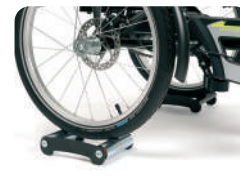
E13 -Função triciclo estático