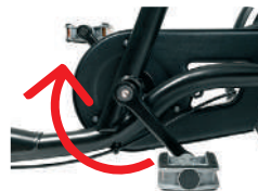
O2 -Travão com os pedais