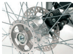
B1 -Travão a disco rodas traseiras