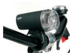
E2 - Luz dianteira e traseira