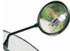
E8 -Espelho retrovisor