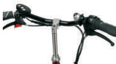
S2 -Guiador reto