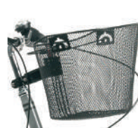
E14 -Cesta dianteira