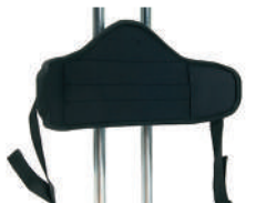
P1 -Suporte pélvico