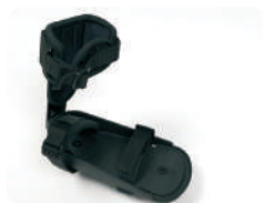
F4 -Pedais com tira para o tornozelo