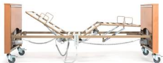
Com Rastomat (cremalheira)