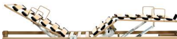
Estrado de madeira