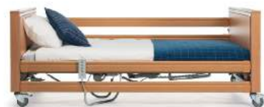
Guardas de madeira