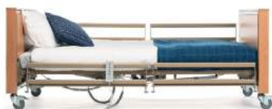
Guardas partidas (metal ou madeira)