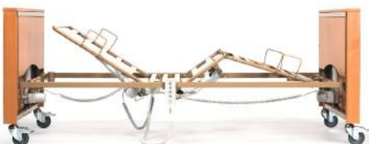
Sem Rastomat (cremalheira)