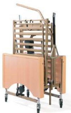
Kit de transporte

A configuração pode variar dependendo da tua região. Por favor, consulta a folha de pedido para obter a informação mais atualizada sobre as opções disponíveis.