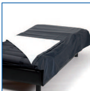
Capa em PVC impermeável e transpirável. De série só para o modelo MAT X3