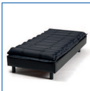
Colchão sobre a cama (só fins ilustrativos)