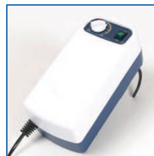
Compressor elétrico de ciclo alternante com regulação de pressão