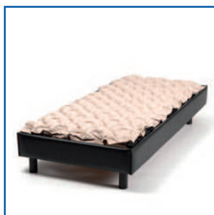
Colchão sobre a cama (só fins ilustrativos)