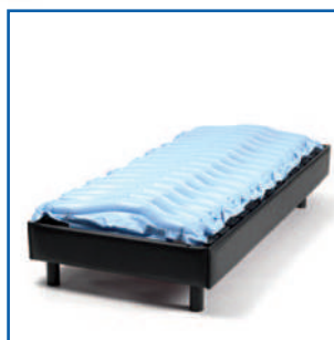
Colchão sobre a cama (só fins ilustrativos)