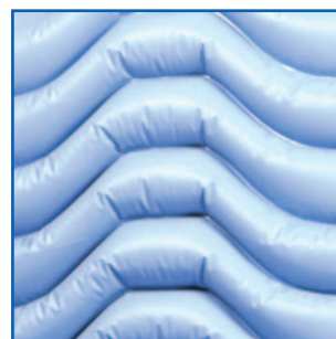
Mat X2 detalhe