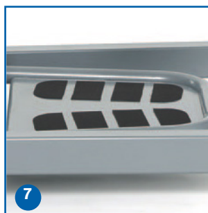
Placa de apoio de pés antideslizante