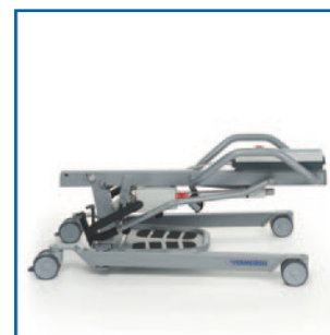
Totalmente dobrável para transporte